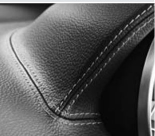
Tapizado en símil cuero ARTICO ▲