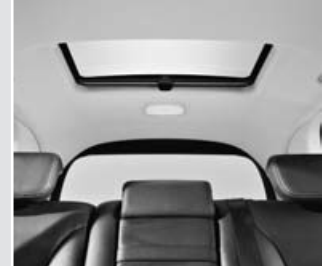
▲ Techo panorámico trasero

Faros y piloto antiniebla con reborde cromado Filtro de partículas diesel (DPF) Iluminación de entorno (luces integradas en parte inferior de retrovisores exteriores) Limpialuneta de conexión automática al acoplar marcha atrás con intervalos Limpiaaparabrisas con mando por pulsación y sensor de lluvia Línea de cintura cromada Llantas de aleación de 5 radios (275/55 R19) Luces de salida y reflectores en 4 puertas, reflector adicional en portón trasero Luces de circulación diurna con reborde cromado Luces diurnas en tecnología LED Paquete técnico Offroad-Pro* Paragolpes y listones protectores en color de carrocería con listón cromado Pilotos traseros LED con aplicaciones cromadas Protección antirroce de acero inoxidable efecto cromado brillante, en paragolpes trasero (1) Regulación del alcance de las luces Retrovisores abatibles eléctricamente, esféricos y calefactados Retrovisores en color carrocería con intermitentes integrados Sensores de impacto ARCADE Sistema eléctrico de tracción total e integral permanente incluye 4ETS Tiradores de puertas en color de carrocería con aplicaciones cromadas