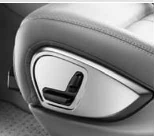
Asientos delanteros ▲ con ajuste eléctrico