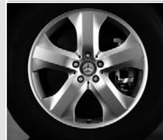
▼ Llanta de 5 radios