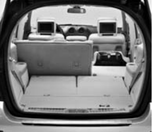
Banco trasero abatible ▲