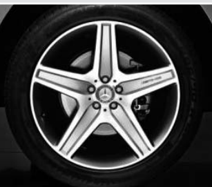
Llantas de aleación AMG ▲ de 5 radios (777)