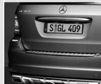
▲ Protección antirroce