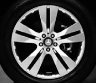
Llantas de aleación de ▲ 5 radios dobles (R33)