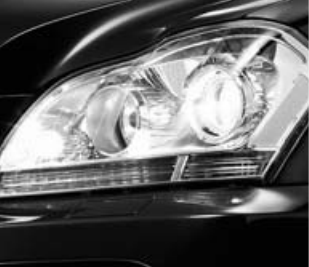
Faros bixenón ▲