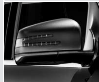
▲ Retrovisor con Intermitente integrado